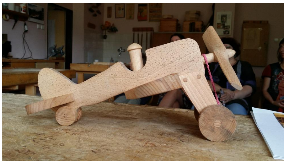
Závěrečná akademie a jarmark