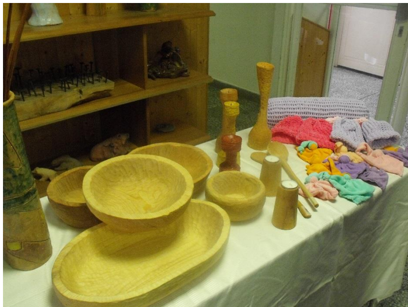
Akce školy – lyžařský výcvik, pobyt v Rožkopově