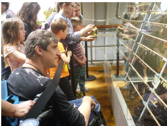
Návštěva Fata Morgany