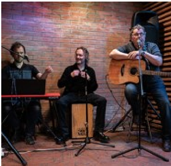
Benefice u Pecků

Na jaře jsme prošli kontrolou z MHMP ohledně plnění registračních podmínek.